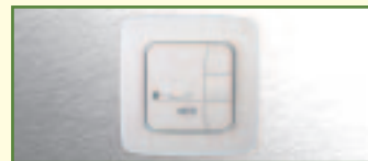
Das variable Steuergerät