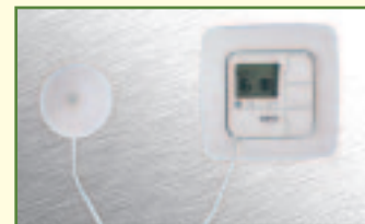
Komfortable Zeitschaltuhr mit Dämmerungssensor