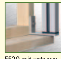
EF20 mit unterem Haltewinkel

a) Nischenmontage seitlich durch die Führungsschiene. b) Freitragendes System mit verstärkten Führungsschienenprofilen, mit nur einer sichtbaren unteren Konsolenbefestigung. Ab Höhe von ca. 2 m mit zusätzlicher mittlerer Klemmkonsole. Farben laut Firmenkollektion oder in RAL nach Wahl beschichtet.