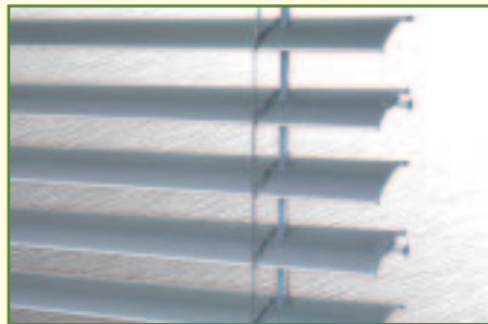
Lamelle ST 80

Lamellenbreite 80 x 0,45 mm stark, beidseitig gebördelt aus Aluminium, einbrennlackiert. Tiefgezogene Lamellenstanzungen zur Schonung der Aufzugsbänder. Wechselweise seitliche