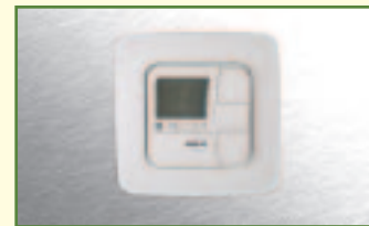
Steuergerät für Sonnenschutzanlagen