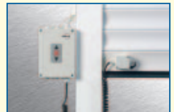
Rolltor-Sicherheitsendleis- tungsabschaltung mit Torsteuerung

Universelle Einsetzbarkeit, sowohl für Rohrmotoren als auch für Getriebemotoren, DIL-Schalter zur individuellen Anpassung der Steuerung an unterschiedliche Funktionsanforderungen, problemloser Anschluss aller gängigen Schließkantensicherungen und Funktionsmeldung über den Zustand des Tores sowie Busfähigkeit.