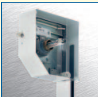
Kastendetail mit Verriegelung für Nothandkurbel