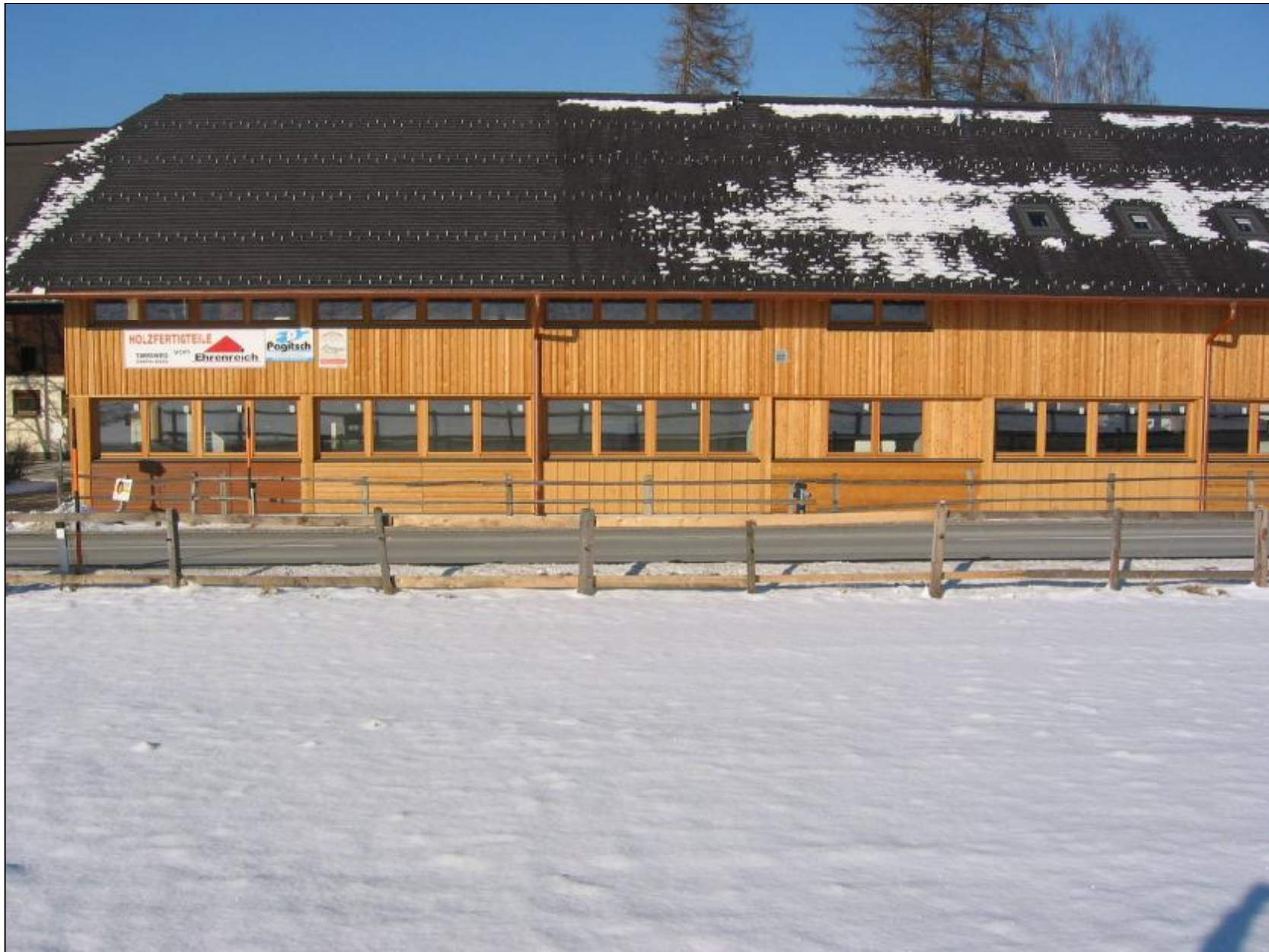
Gesamtansicht am 11.Jänner 2003